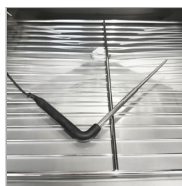
Capteur central inclus