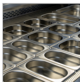
Conçu pour des bacs GN1/1, non fournis