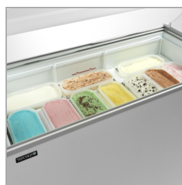
L'option de panier à glace