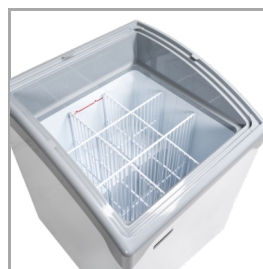
Système de cloisons