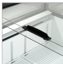
Couvercles vitrés coulissants