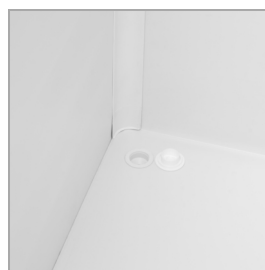
Vidange du dégivrage