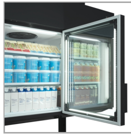
Éclairage LED dans le cadre de la porte