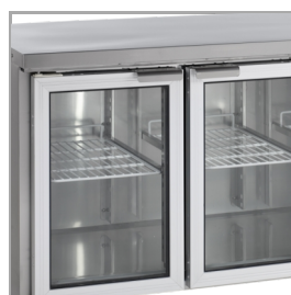
Cadres de porte en aluminium et lumière LED