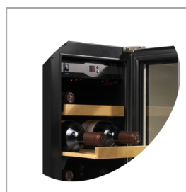
Tablettes à tiroir en bois